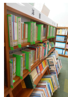
正面の裏側には絵本・児童書やペーパーバックが