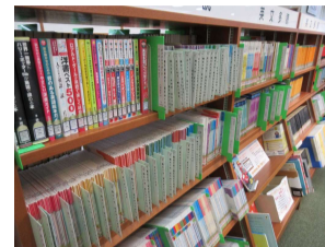
英文多読用資料が前面に配置