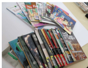
GRのOBW・CER・PGR・MMRや学習用のレベルが高めの本も・・・

学校連携が始まって特に必要となったシリーズの本たち・・・ ICR・UFR・SIRなど (YL0.4-06を中心に)