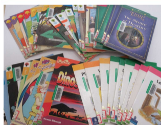
ORT及びORTシリーズとLLLなどの基本的な多読用資料

学校連携が始まって特に必要となったシリーズの本たち・・・ ICR・UFR・SIRなど (YL0.4-06を中心に)