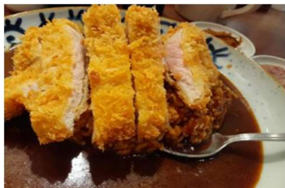
かれー かつカレー