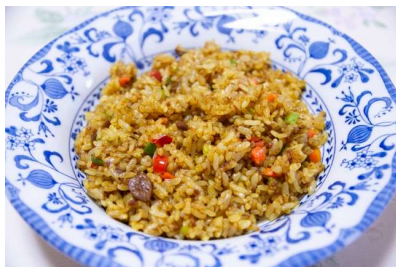
どらいかれー ドライカレー