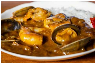
しーふーどかれー シーフードカレー