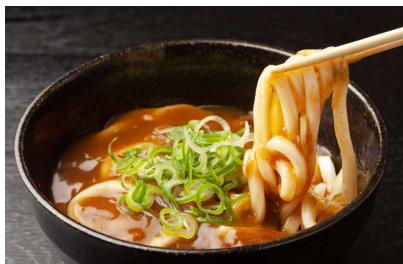
かれー カレーうどん