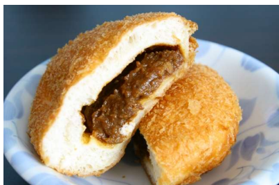
かれーぱん カレーパン