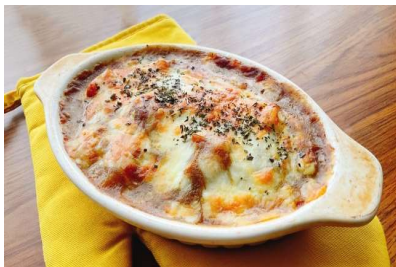
かれーどリア カレードリア