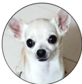
はな 花すけ ちわわ チワワ