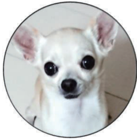
はな 花すけ ちわわ チワワ