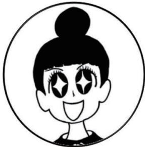
おねえさん はな しゅじん 花すけのご主人