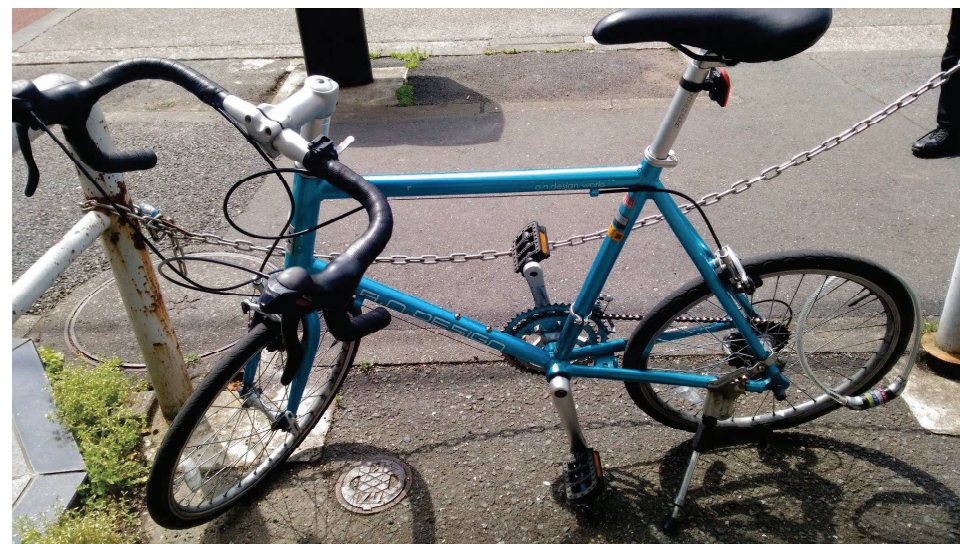
青い自転車(じてんしゃ)