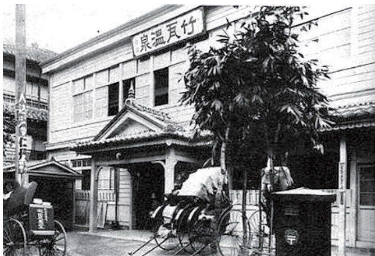
たけがわおんせん むかし いま 「竹瓦温泉」の昔と今