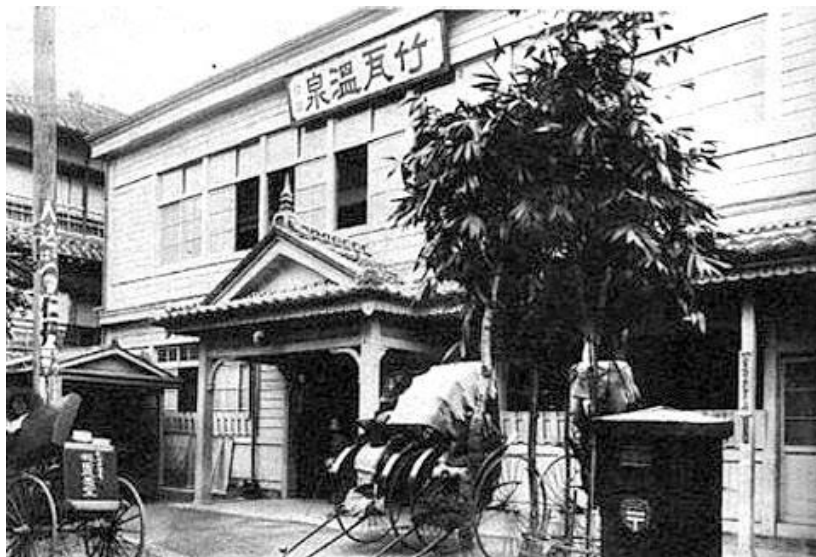
たけがわおんせん むかし いま 「竹瓦温泉」の昔と今